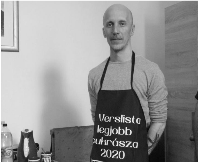
A Verslista legjobb cukrásza 2020-ban

Miattad jobb ember lettem Bár ezt nem mondtam el Még itt vagy benn a szívemben Sose engedlek el