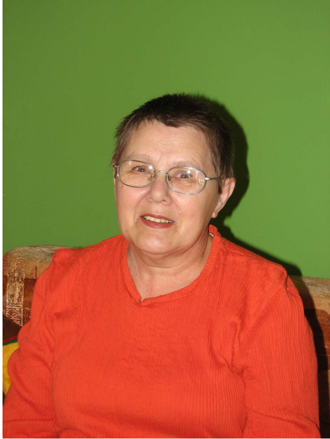
A kötet szerzője